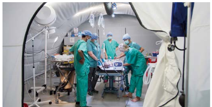
Operationssaal im mobilen Krankenhaus

Das aktuelle Beispiel dafür ist das Feldkrankenhaus in Gaza, das Anfang des Jahres 2024 in der Stadt Rafah in Betrieb gegangen ist – und in dem bis Dezember 2025 bereits fast 200.000 Menschen behandelt wurden. Aus allen fünf Ländern sind Teile dort, Deutschland stellt aktuell gut ein Drittel des Krankenhauses. Genauso international ist das Rotkreuz-Team, das dort arbeitet – denn auch bei dem in der Regel ehrenamtlichen Personal, das auf weltweite Einsätze geht, er-