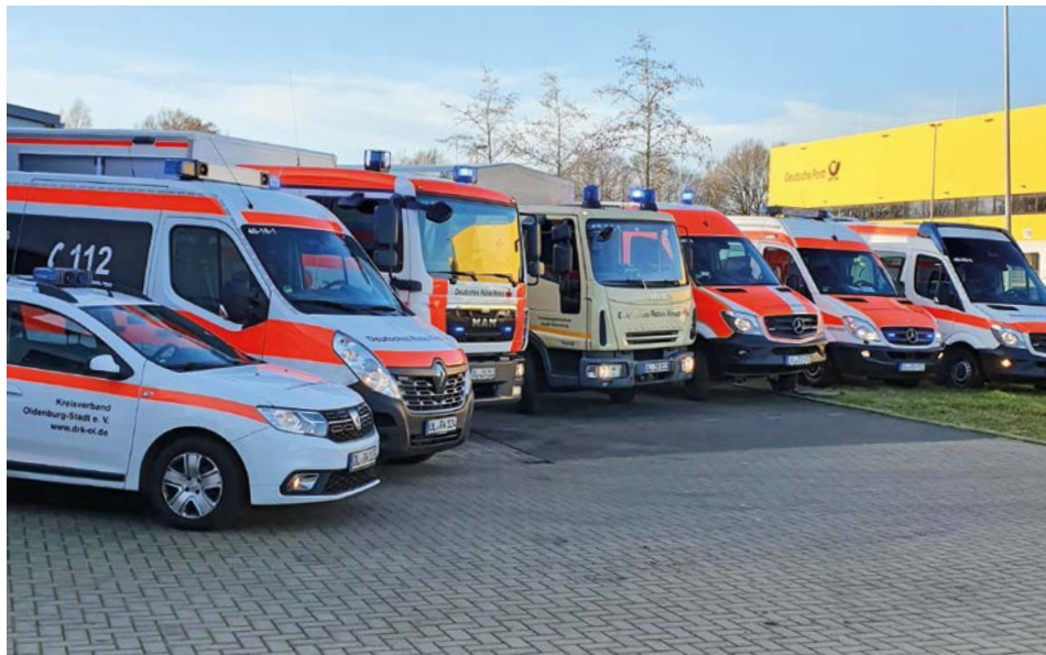
Fahrzeuge der Bereitschaft des DRK Kreisverbandes Oldenburg Stadt e.V.

Ein ehrenamtlicher Führungsstab plant und setzt Maßnahmen um, damit die Corona-Krise in der Stadt weiterhin gemeistert werden kann. „Ziel war und ist es, die Leistungsfähigkeit des DRK in allen Bereichen zu gewährleisten, sowie die Infrastruktur als Hilfsorganisation mit dem größten Anteil